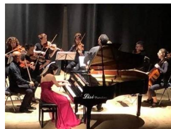
Orchestra Ferruccio Benvenuto Busoni